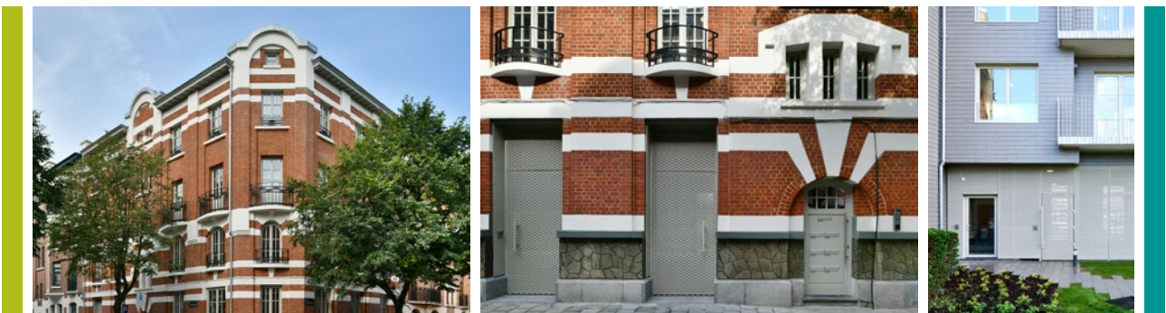
© Roose Peeters Architects + U / Philippe Piraux

(FSH) Schaarbeekse Haard / Trooststraat 70 / B-1030 Brussel / T- 02 240 80 40 lefoyerschaerbeekois@fsh.be / foyerschaerbeekois.be